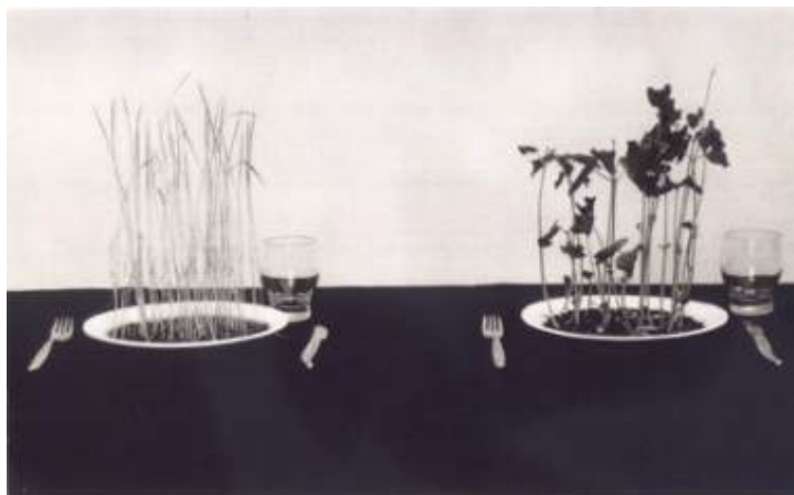
Figura 7: "Arroz e Feijão", Anna Maria Maiolino, 1979 11