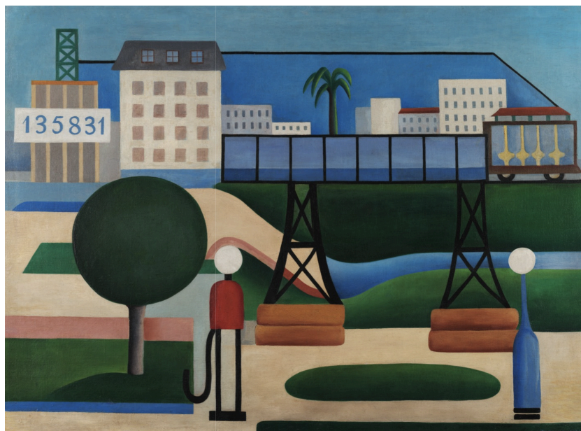
Figura 1: "São Paulo", Tarsila do Amaral, 1924 2

Aqui, a estética importada é utilizada como meio para se falar de uma temática popular e nacional brasileira. 3 Ao abordar o modernismo latino, Dawn Ades afirma que: