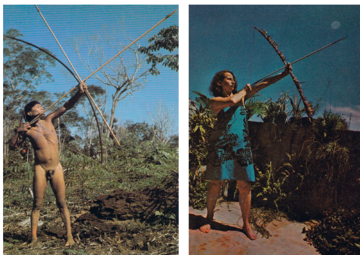
Figura 6: "Brasil Nativo, Brasil Alienígena", Anna Bella Geiger, 1976-77 10

Se Santa Cruz usa sua voz para dominar e contar sua própria narrativa, em Brasil Nativo, Brasil Alienígena (1977), Anna Bella Geiger usa da apropriação imagética e do autorretrato para questionar o olhar fetichista vindo do colonizador europeu sobre a população originária do Brasil.