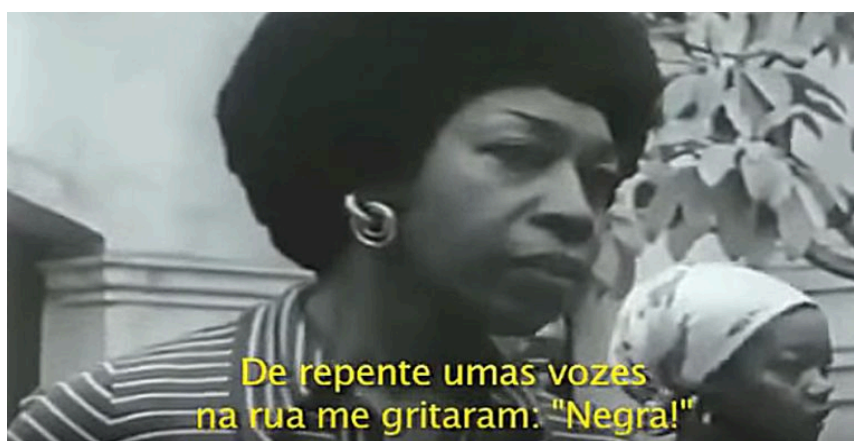
Figura 5: "Me gritaron negra", Victoria Santa Cruz, 1978 8

Uma das pautas levantadas pelo Grupo M/C, como já citado anteriormente, é a Colonialidade do Poder. Entender como a questão da identidade de raça é uma peça central e resultado direto da colonização, faz parte do compreender a América Latina por um viés decolonial. E compreender-se como uma mulher latina racializada é o que Victória Santa Cruz usa como temática em sua obra Me gritaron negra , de 1978.