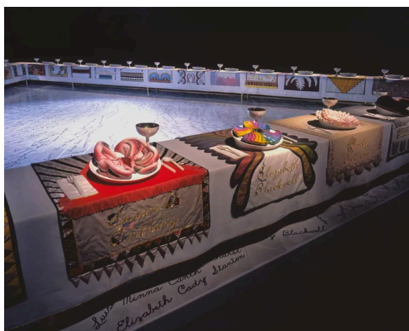
Figura 4: "The Dinner Party", Judy Chicago, 1979 7

Tomemos como exemplo a instalação The Dinner Party , de 1974-79, criada pela estadunidense Judy Chicago. Exibida pela primeira vez no Museu de Arte Moderna de São Francisco, a obra traz para a sala expositiva uma enorme mesa triangular com 39 lugares demarcados, decorados para um banquete. Cada um deles é destinado a uma figura feminina que fez parte da história ocidental; dispostos em cima de toalhas de mesa ricamente bordadas, há pratos de cerâmica com formas de vulvas que ganham destaque como peça central de cada lugar. Além disso, 999 nomes (de mulheres) estampam a superfície em que a mesa está localizada.